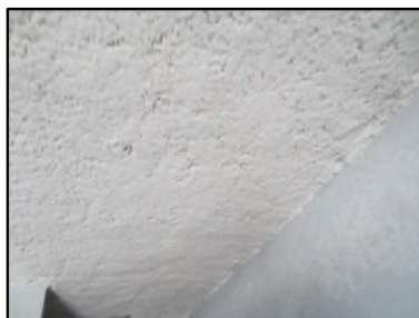
Photo N° 610 ECH-N°2 FLOCAGE -- LOCAL VELO Plafonds Blanc cotonneux